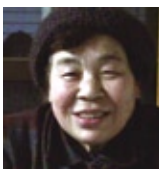
みさき旅館 電話番号 0820・66・2001

本当に頑張ってるっしやるでしょうから、頑張ってるさいと伝えません。皆さん前向きに頑張っておられるし、必ず良い方向に向かって行くと思います。瀬戸内の島から応援しています。祝島が絶対一円の補償金も貰わないと決め、三十年間原発建設計画に反対運動を続けていますので、いつか福島の皆さんも祝島へ遊びにいらして下さいね。それでは、お体に気をつけて。