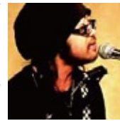
福島で知り合ったミュージシャン。農業をやりながら音楽活動中。 http://p.tosp.co.jp/i.aspr/saitama

福島で農家やりながら音楽活動してます。風評被害、実害、などなどありますが福島は生きてます。ありがたい頑張るうや、負けないとかの類のスローガンには反吐が出る感もありますが福島で生きていきます！ってそんな内容の歌は一曲もないのですが、福島発アコースティックバルチザンぶつ放しに行きます。