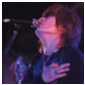
常に自覚的なロックンロールバンド LOOSE RIDER http://www.nc.jp/asahi/looserider/official/

長崎出身と言うこともあり9年前前に被爆者の原爆症認定集団訴訟の運動に関わらせてもらったり、支援CDに曲を提供させてもらったりした辺りから、俺の中で核兵器廃絶！原発反対！と言うしつかりとした柱が出来上がった様な気がする。