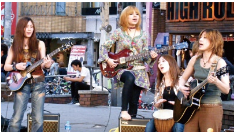
基本どこでもできる！電気がなくても楽しめる！編成にこだわらない変幻自在の音楽ユニット「新月灯花」。便利で身勝手な世の中でしか生きていけない私たち。もっと自由で自然な解放を表現したい！

私たち新月灯花は、3月10日に山口県柳井市の脱原発デモ、11日は福島の脱原発デモに参加してきました。そして翌日は、上関原発建設反対を30年続けていく祝島に行きました。そして、福島の人たちに応援メッセージを頂いてきました。原発の被害の真つ只中にある福島の人たち。その元凶である原発を作らせないため30年間闘い続ける祝島の人たち。今、この二つの環境にいる人たちの意志の疎通や共鳴が、子供の未来に重要な役割を果たすのではないだろうか。だから、繋いでみたい。