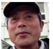
祝島島民の会ブログ http://blog.shimahi.to.nc/

私も福島の事が気になって昨年5月に行ったんですがあの時は本当に悲惨で・・・今も変わってない所もあるかと思いますが、本当に大変でしょうけど、被災地の原発開発計画もあの事故以来止まっています。私達も、再び原発が作られない様に、二度と福島での事故の様な事が起こらない様に、原発建設計画に反対しています。福島が一日も早く復興できるように応援したいと思っています。頑張ってください！