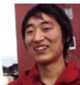
19歳の時、東京都中野区から祝島に住んで反対運動を続けている。

僕は2009年から上関の事でずっと活動していて、中国電力が原発を建てる為に海を埋め立てにくるのをずっと阻止してきました。福島の事故以来、中国電力も海の埋め立てをストップしていて、こちらは少し落ち着いています。